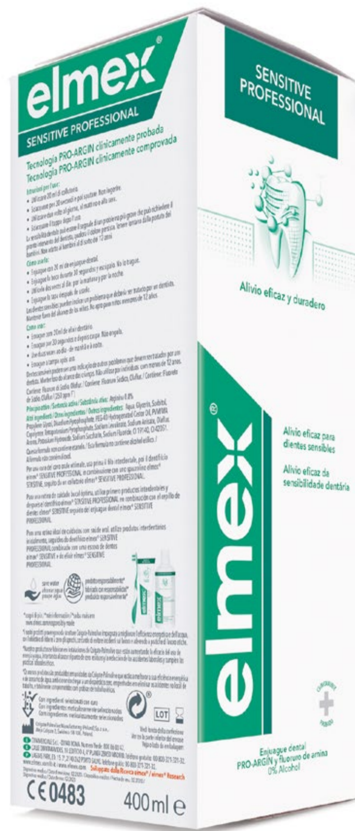
Enjuague elmex® SENSITIVE PROFESSIONAL™ 400ml C.N.: 199302