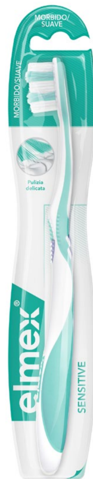
Cepillo elmex® SENSITIVE C.N.: 199270