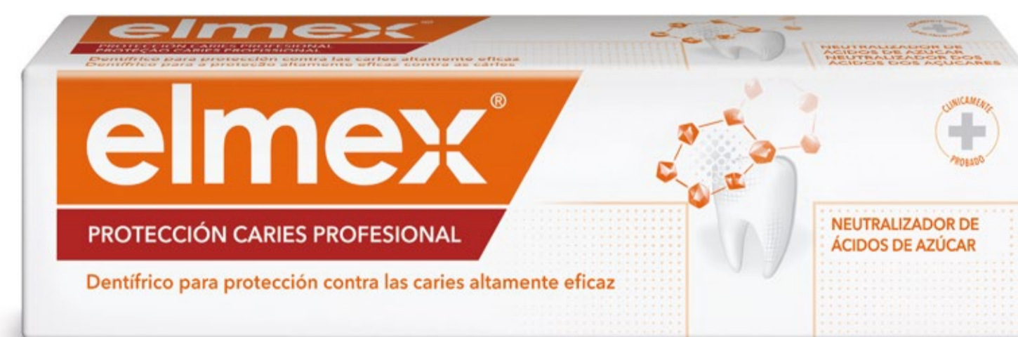
Dentífrico elmex® PROTECCIÓN CARIES PROFESIONAL 75ml C.N.: 199301