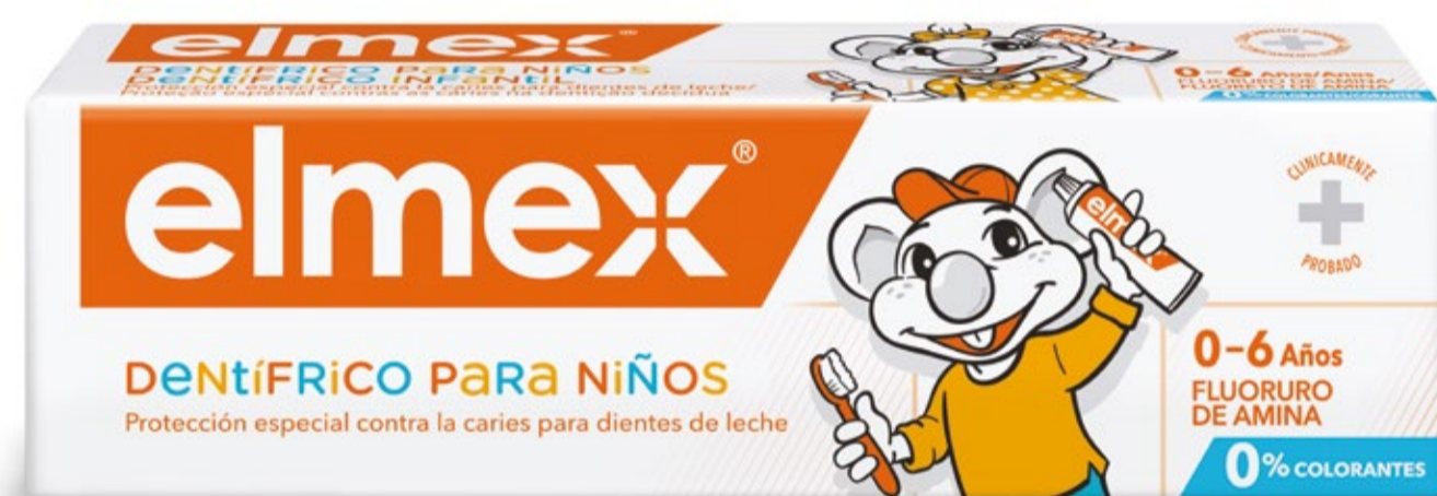
Dentífrico elmex® KIDS 50ml C.N.: 240010

Elmex® anticaries para adultos y niños con tecnología Olaflur 2 ofrece una mayor biodisponibilidad de flúor y efecto antibacteriano para una mayor protección frente a las caries; sin necesitar conservantes adicionales como el LSS.