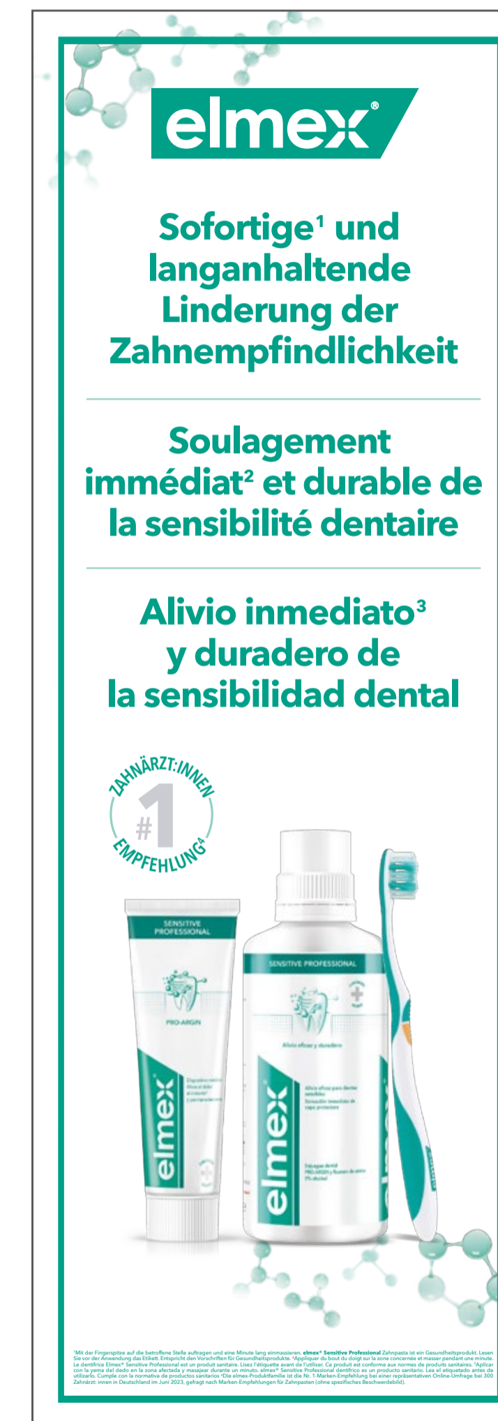
100000950 elmex® VINILO 2024 50 x 130 cm