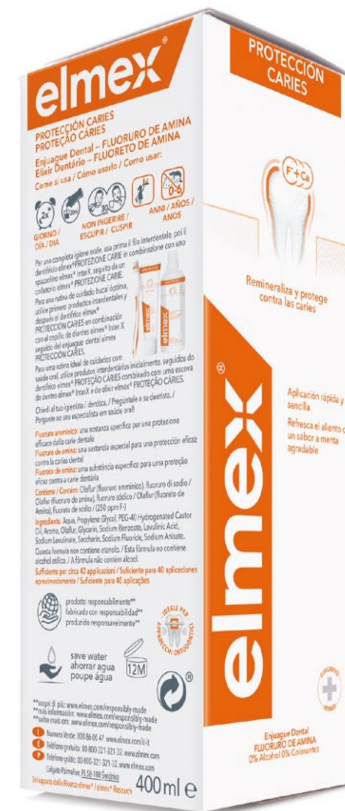
Enjuague elmex® PROTECCIÓN CARIES 400ml C.N.: 368498