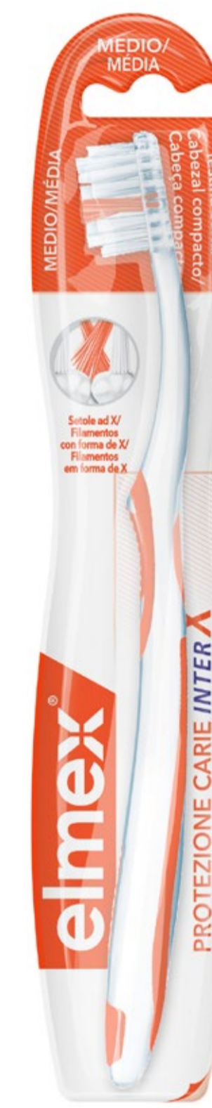
Cepillo elmex® PROTECCIÓN CARIES C.N.: 199269

2 Tecnología incorporada en elmex® KIDS, elmex® JUNIOR y elmex® ENJUAGUE.