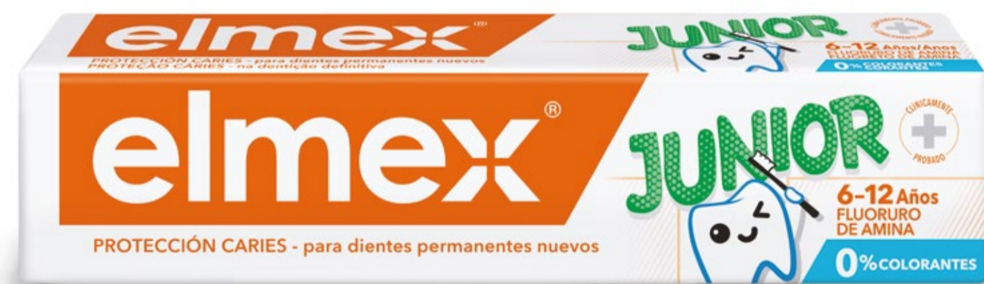
Dentífrico elmex® JUNIOR 75ml C.N.: 155686