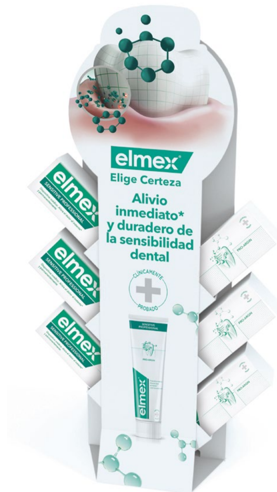
1002005031 elmex® TIRAS 2024 15x44x8cm