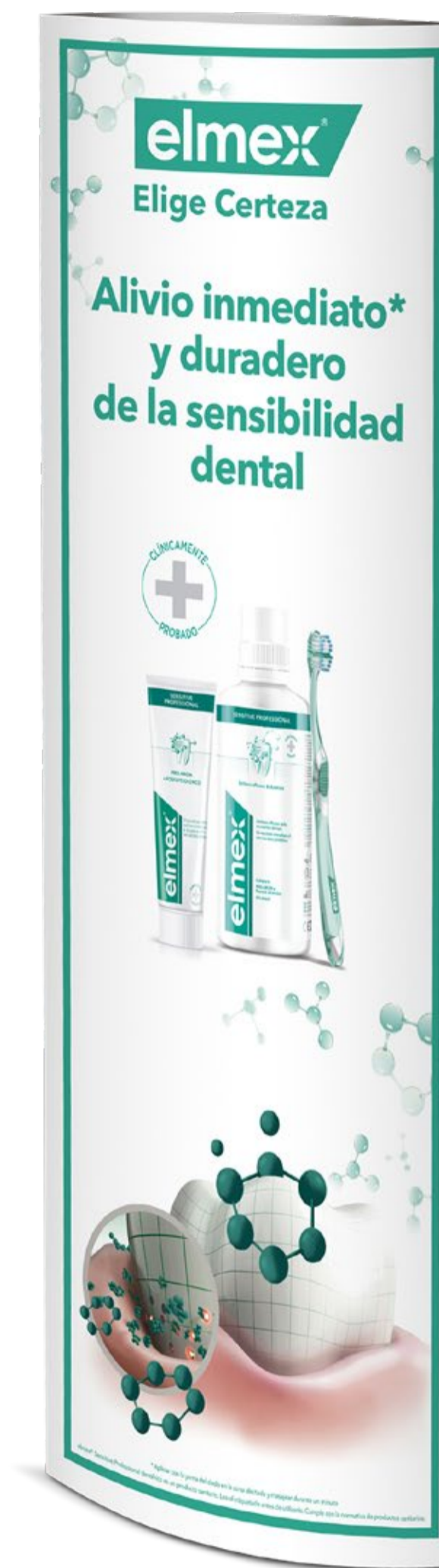
1002005024 elmex® TOTEM 2024 50 x 130 cm