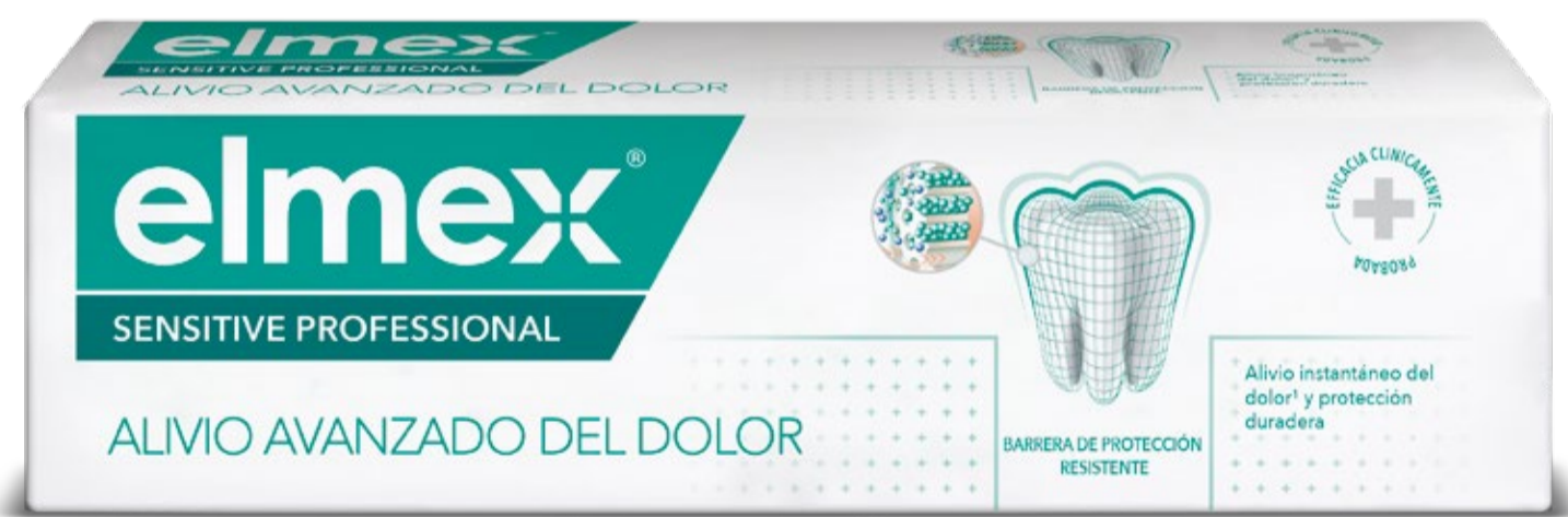
Dentífrico elmex® SENSITIVE PROFESSIONAL 75ml C.N.: 199058

El sistema (dentífrico + enjuague) con la tecnología Pro-Argin® reduce la hipersensibilidad dentinaria 2 veces más que un sistema de sales de potasio, tras 2 y 8 semanas de uso 2