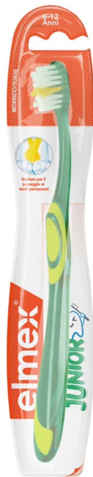
Cepillo elmex® JUNIOR C.N.: 199268